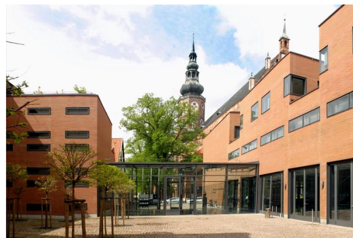
Alfried Krupp Wissenschaftskolleg Greifswald/Vincent Leifer